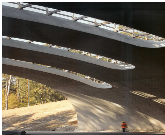
Ukázka díla našich klientů.

byly efektivně tvořeny je nezbytný komplexní pohled. Pokud takový pohled není uplatňován, není zaručeno správné řízení rizik ani jejich prevence ve všech fázích přípravy a realizace stavby. Práce, které nejsou prováděny v souladu s požadavky na bezpečnost a ochranu zdraví, nemohou být ani kvalitní. Pokud nejsou vytvořeny požadavky na bezpečnost a ochranu zdraví, nejsou a ani nemohou být vytvořeny předpoklady pro zajištění ostatních požadavků, jako kvalita produktu, šetrnost k životnímu prostředí a následná spokojenost budoucích uživatelů díla.